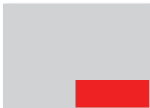
1/3 Seite (im Anschnitt) 148x70 mm 154x76 mm inkl. Anschnitt