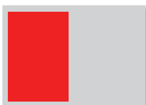
1/1 Seite (im Satzspiegel) 128x190 mm

Seitenumfang: ca. 32 Seiten Auflage: 1.000 Stück Erscheinungstermine: 3 mal im Jahr Format: DIN A5 (148x210 mm) Farbe: 4c