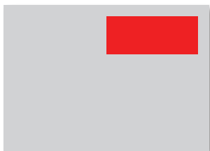
1/3 Seite (im Satzspiegel) 128x60 mm