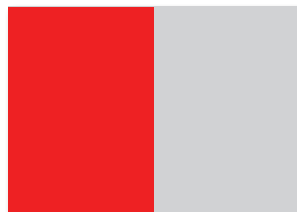
1/1 Seite (im Anschnitt) 148x210 mm 154x216 mm inkl. Anschnitt